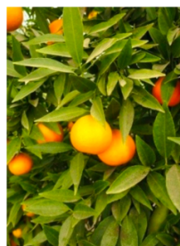
Clémentines corse ( SRA 92)