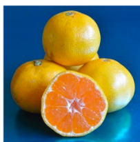
Mandarines Satsuma Okitsu