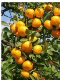
Mandarines Satsuma Iwazaki

Variété Satsuma Iwazaki disponible à partir de septembre