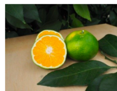
Mandarines Satsuma Owari

Toutes ces variétés ont été choisies car elles sont rustiques d'un point de vue cultural, et sont cultivables dans le sud-ouest.