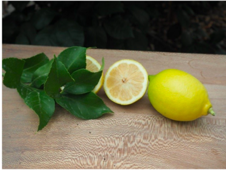
Citron 4 saisons Eurêka

Le citron Meyer est un citron doux issu d'un croisement entre un citron 4 saisons et une mandarine. À maturité, il est jaune orangé.