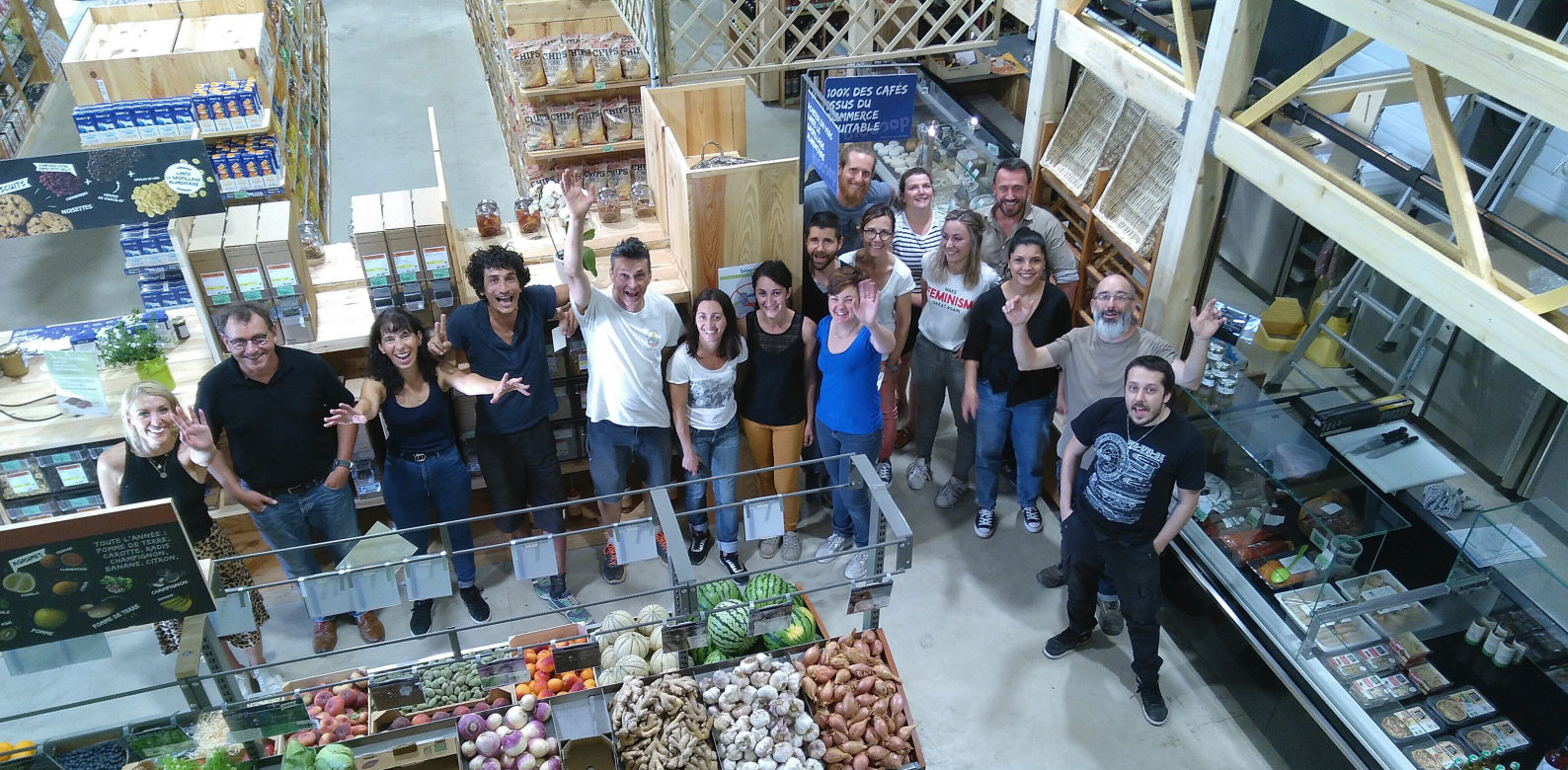
23 juin 2020, J - 1 avant l'ouverture du magasin aux premiers clients